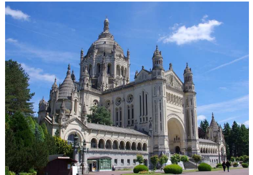
(Basilika St Thérèse Lisieux)

17. bis 23. Oktober 2021 (Herbstferien NRW)